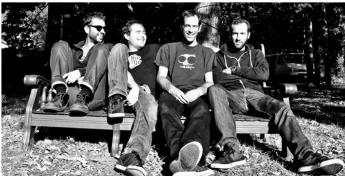
Loose Division © Antony Révon

Sous le jeu de mots évoquant les slows déchirants de nos boums d'ados, Les Carreleurs américains , masse tatouée et chevelue, ressuscite sans aucun complexe les tubes mythiques du Hard Rock en fanfare. C'est une succession énergique de standards inoubliables des plus grands groupes, d'AC/DC à Nirvana, de Led Zeppelin aux Rolling Stones en passant par Téléphone, Trust et Niagara.