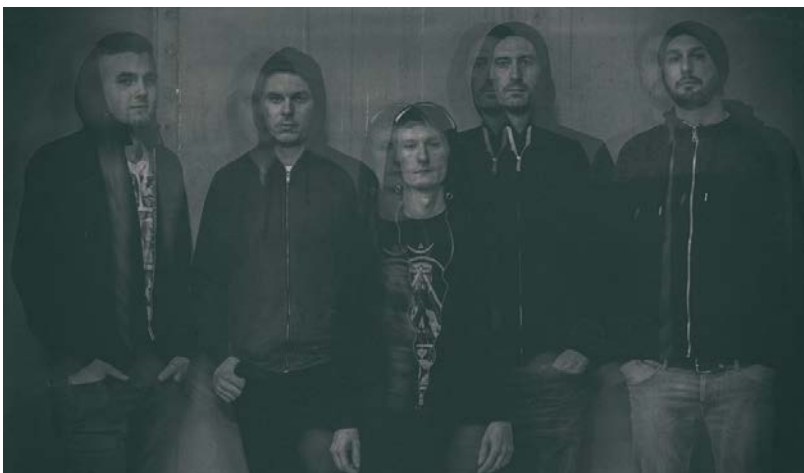
20 Seconds Falling Man