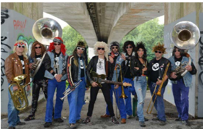
Les Carreleurs américains