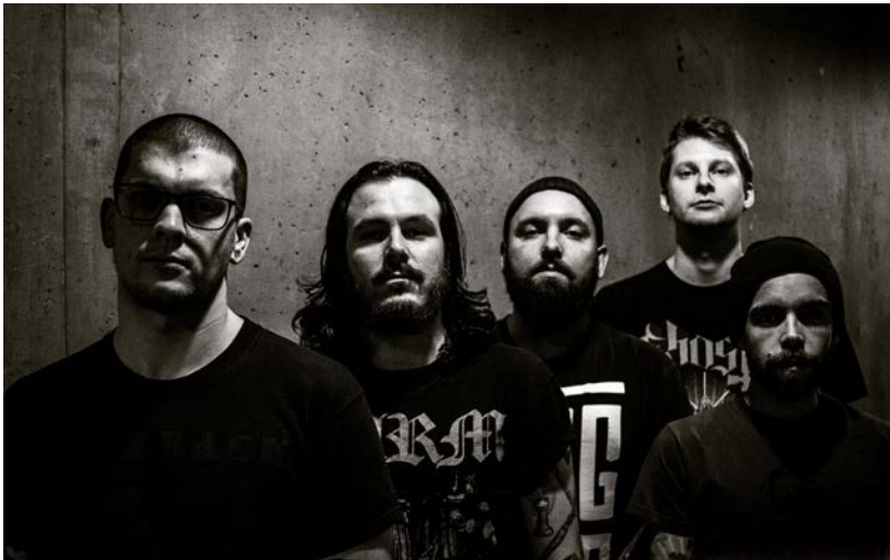
MNFCTRR

Formé en 2015, MNFCTRR (prononcez Manufacturer) est un groupe qui joue un Metal à mi-chemin entre l'hommage aux grand groupe US comme Lamb of God ou Obituary et la fraîcheur de la nouvelle scène Crossover comme Power Trip, Iron Reagan, Insanity Alert... C'est sur scène que la musique du combo nantais développe son intérêt et sa puissance.