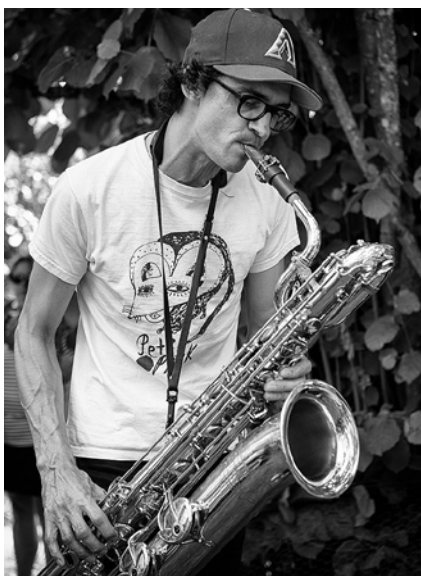
Xavier Thibaud

Après plus de 10 ans de mix et de rencontres musicales avec des artistes pointus tels que Sadar Bahar, Andrès, Simo Cell, Mike Huckaby, Call Super, Bradley Zero, Waxist, Raphael Fragil, Beautiful Swimmers ou encore Hugo Mendès, DJ Shaman Boil, digger avisé, maîtrise l'art du dancefloor et mène les danseurs entre groove nerveux et douceur mélodique tout en prônant une Dance Music fine et éclectique.