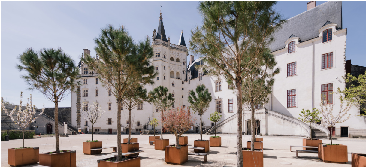
David Gallard / LVAN

Afin de vous accueillir au mieux et dans le respect des règles sanitaires, le Château des ducs de Bretagne adapte son offre et met en place de nouveaux outils. Toutes les offres font l'objet d'une réservation obligatoire.