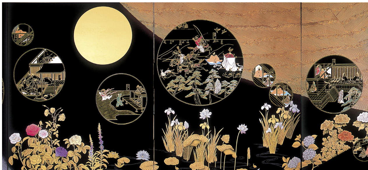
La vie illustrée - été © Toshihiro Hamano

Des visites en autonomie sont possibles.