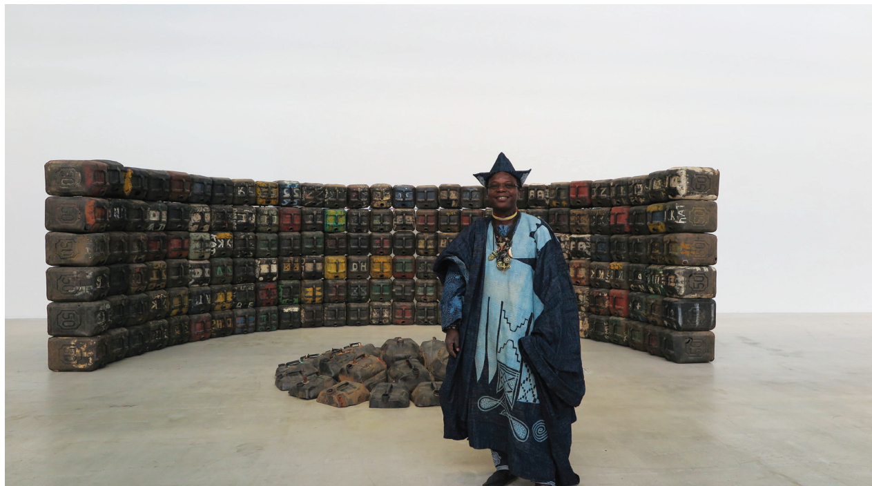
© Romuald Hazoumè, ADAGP / Courtesy Galerie MAGNIN-A

Des visites en autonomie sont également possibles.