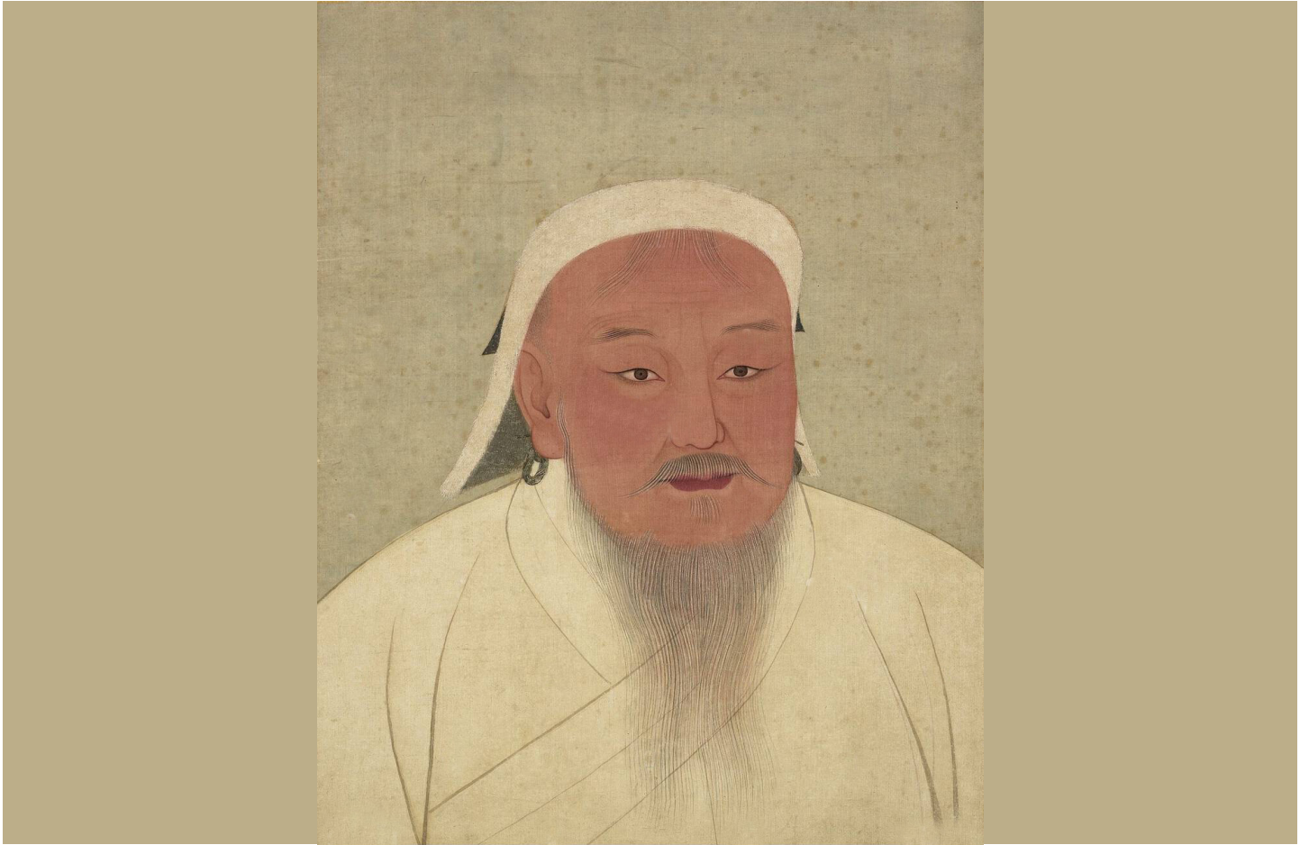
Portrait de Gengis Khan