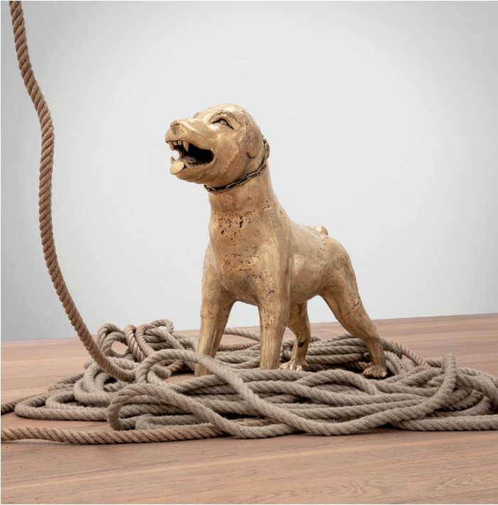
Strange Fruit © Barthélémy Togo / Courtesy Bandjoun Station & Galerie Lelong & Co