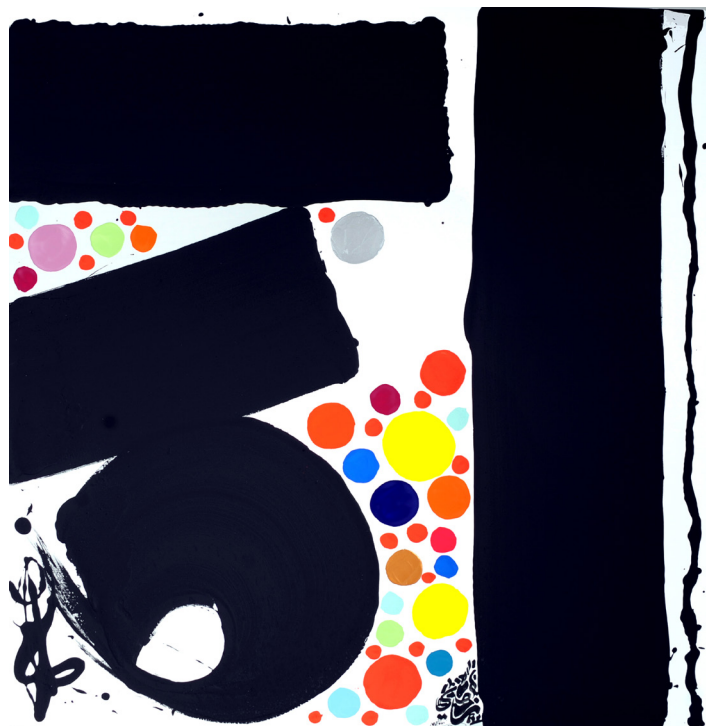
Temporel© Lassaâd Metoui