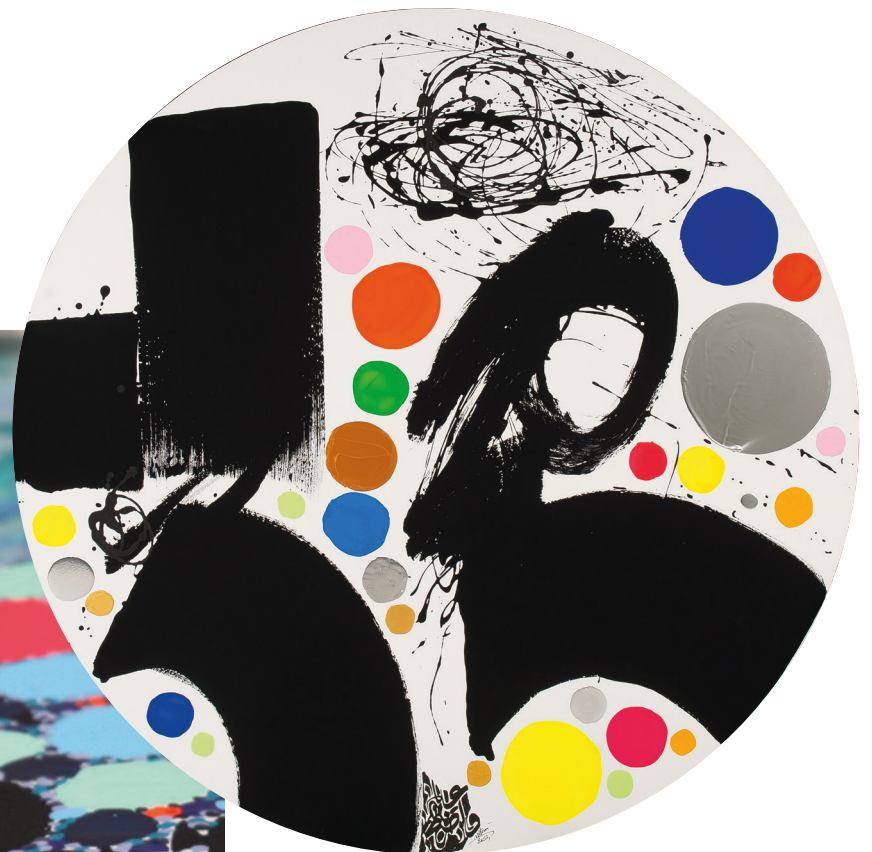
180-LE MONDE DE L'INTELLIGIBLE 2 - 2023 Pigments naturels, Acrylique sur toile, tondo 170 Lassaâd Metoui © Le Labographique