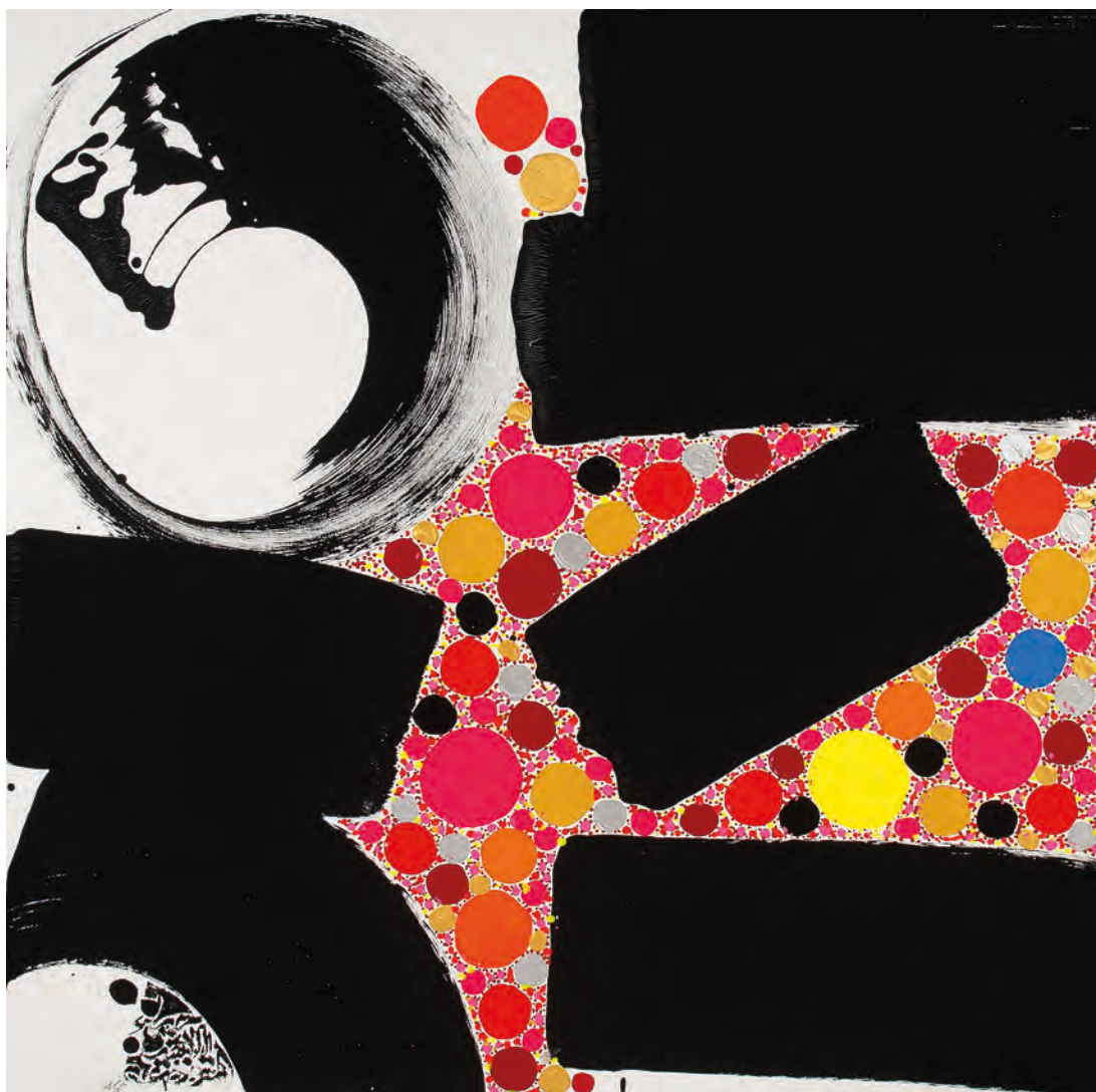
117-HOSIMI 5 L'AMOUR DES CHOSES HUMILES ET LA DÉCOUVERTE DE LEUR BEAUTÉ 100%NOIR - 2023 Pigments naturels, Acrylique sur toile, 150x150 Lassaâd Metoui

Et pour toutes ces raisons, il est primordial pour moi que les artistes aient un sens éthique et s'engagent à travers des valeurs.