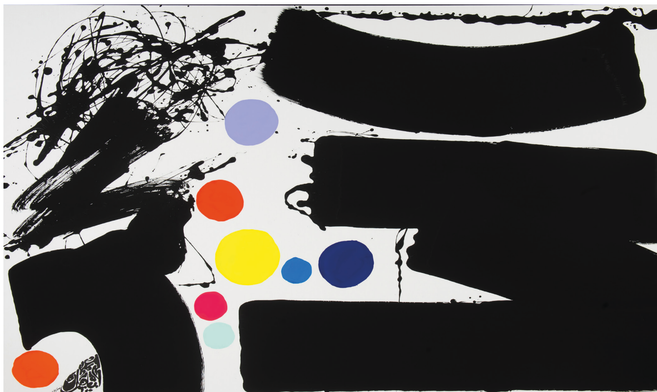
69-MÉDITATION 6 D'APRÈS NISHIDA KITANO - 2024 Pigments naturels, Acrylique sur toile, 200x140 Lassaâd Metoui

Dans l'exposition Ivresse de l'encre , le Japon a un écho très prononcé dans les œuvres de l'artiste. En lien avec les écrits du philosophe japonais Nishida Kitarō, ses compositions créées à partir d'encre japonaise sur du kozo sont enrichies de motifs picturaux inspirés de grands maîtres, tels que Hokusai (1760-1849) et Hiroshige (1797-1858).