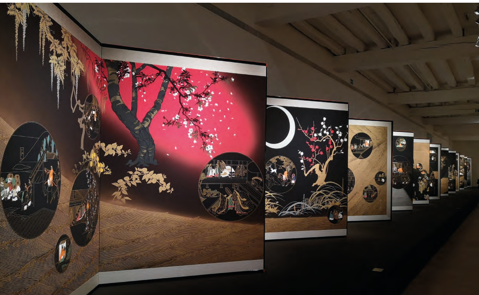
Toshihiro Hamano © LVAN