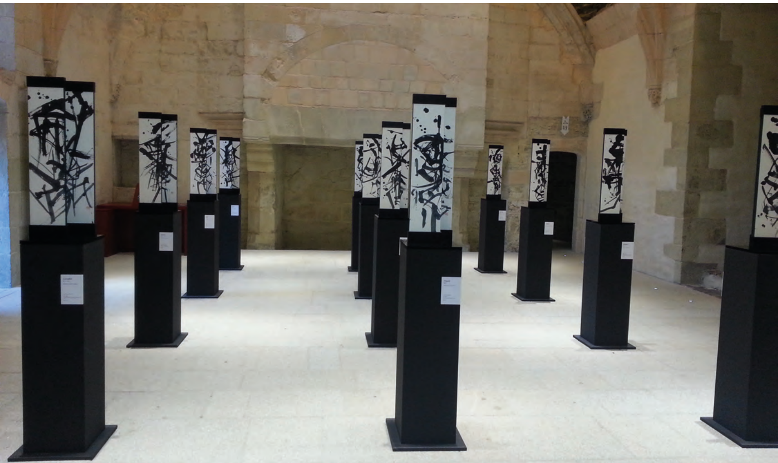
Kametani Kakushō