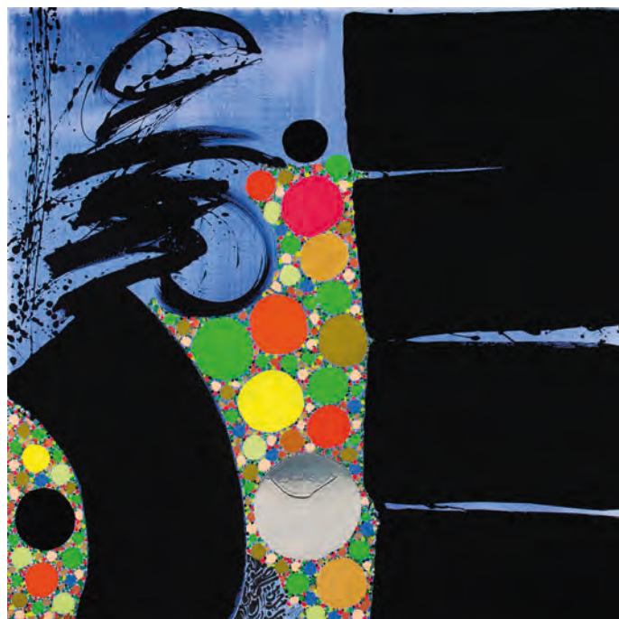
087-KAMOREBI 1 ULTRAMINE BLEU - 2023 Pigments naturels, Acrylique sur toile, 160x160 Lassaâd Metoui