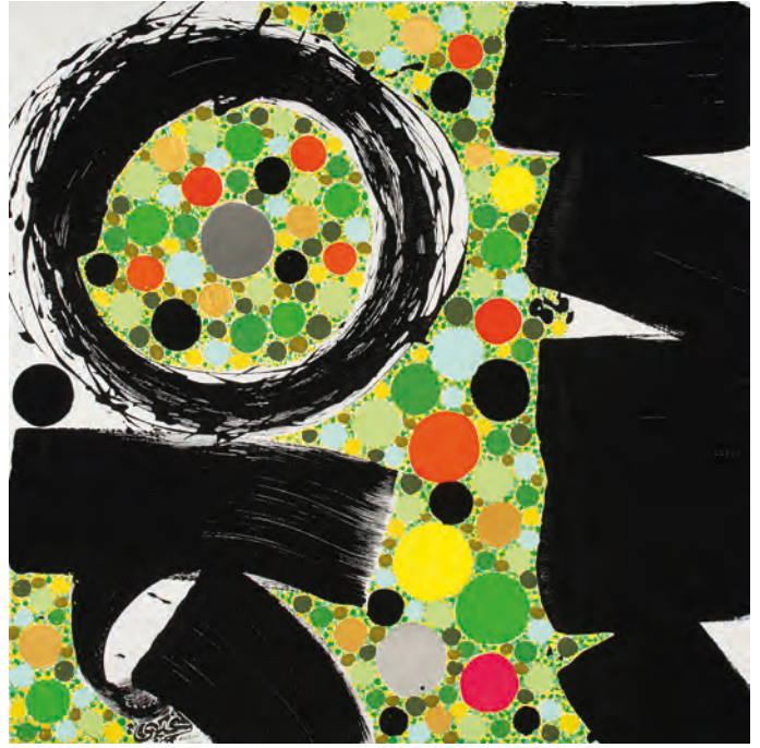
138-METAPHYSIQUE 1 - 2023 Pigments naturels, Acrylique sur toile, 150x150 Lassaâd Metoui © Le Labographique