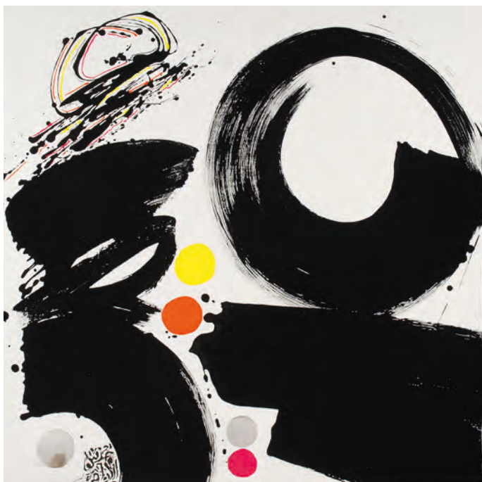
132-INTUITION DE LA VOLONTÉ 3 - 2023 Pigments naturels, Acrylique sur toile, 150x150 Lassaâd Metoui