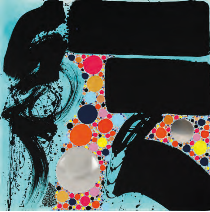
094-KOMOREBI 5 MONOCHROME TEAL BLEU LAGON - 2023 Pigments naturels, Acrylique sur toile, 160x160 Lassaâd Metoui