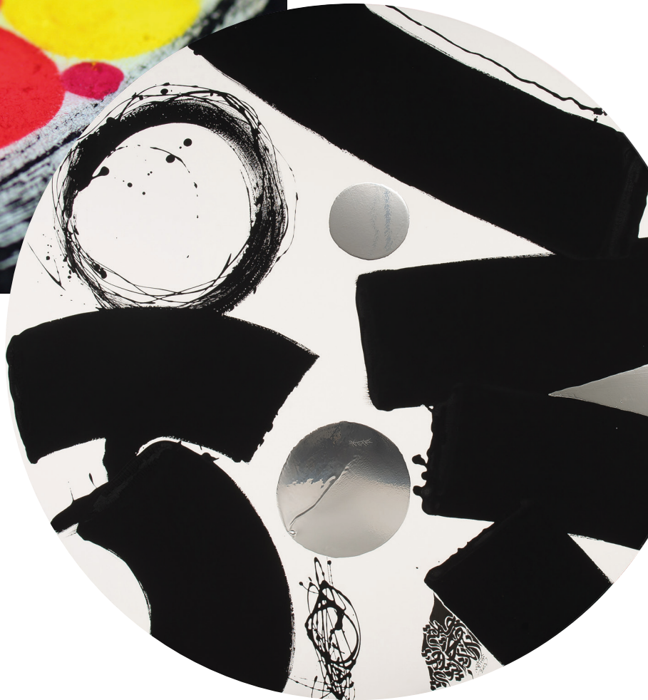
167-UNIVERSEL DE L'AUTOÉVEIL Pigments naturels, Acrylique sur toile, tondo 170 Lassaâd Metoui