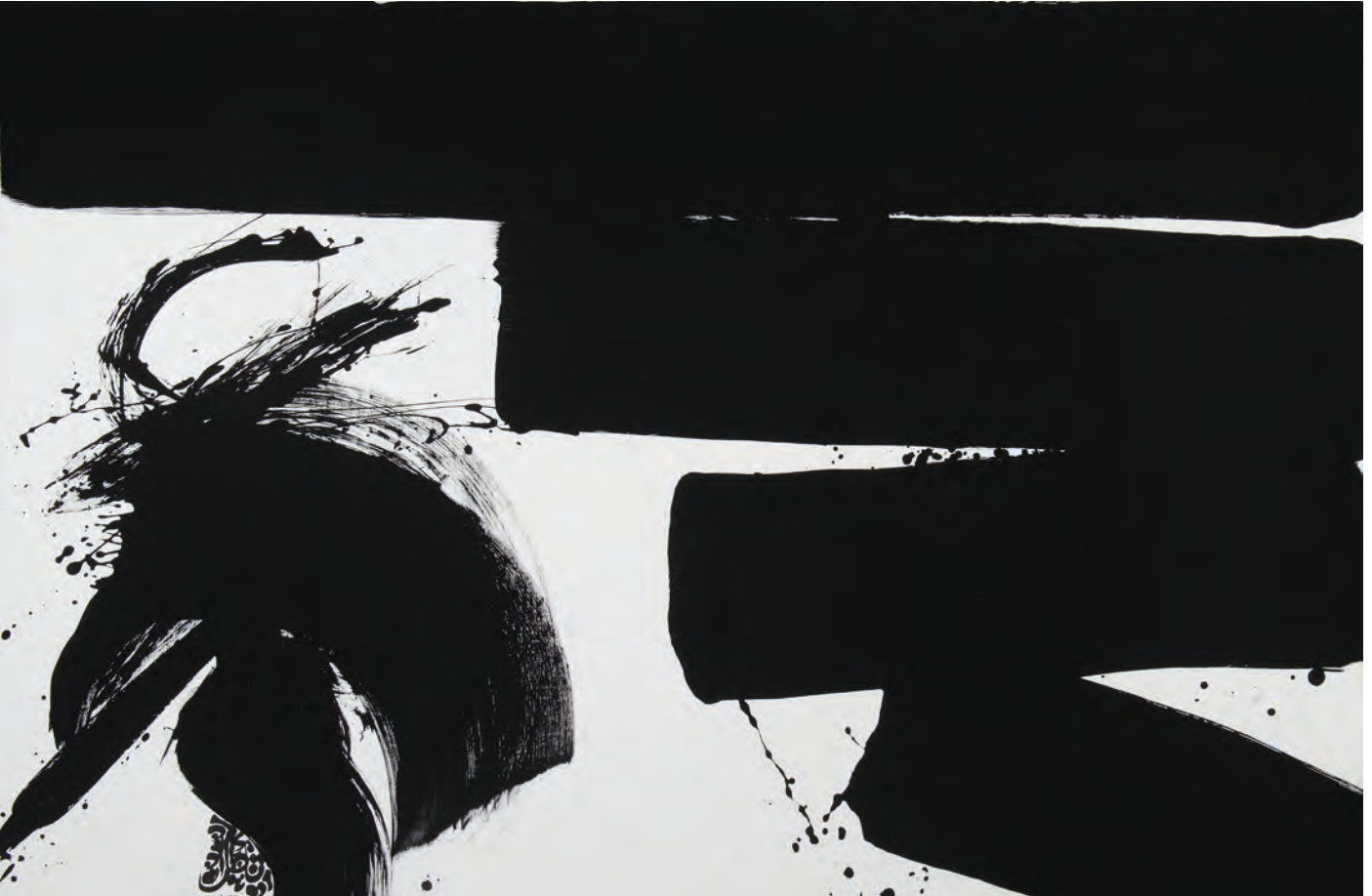
063-MEDITATION D'APRÈS NISHIDA KITANO - 2024 Pigments naturels, Acrylique sur toile, 200x140 Lassaâd Metoui