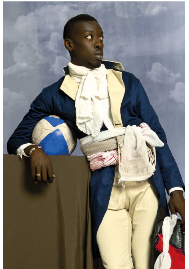
Omar Victor Diop, Jean-Baptiste Belley, 2014 © Omar Victor Diop, ADAGP 2025, Courtesy Galerie Magnin-A, Paris